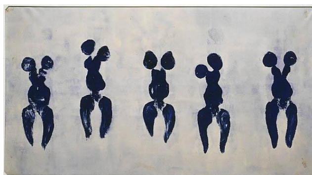
Yves KLEIN , Anthropométrie de l'époque bleue (ANT 82), 1960